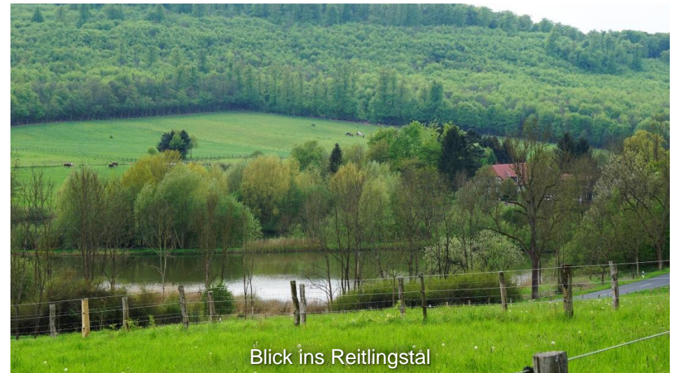
Blick ins Reitlingstal