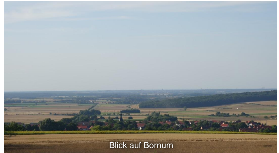
Blick auf Bornum

Die herrliche Wiesenlandschaft ist einmalig im Elm und lädt zu einer kurzen Pause ein. Hierfür bietet sich die direkt an der Strecke liegende Gaststätte Reitling im Elm an. Wer aber lieber seinen mitgebrachten Proviant verzehren möchte, findet auch ausreichende Rastmöglichkeiten in diesem wunderschönen Tal.