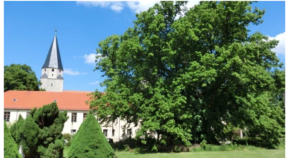
Kaiser-Lothar-Linde und der Kaiserdom