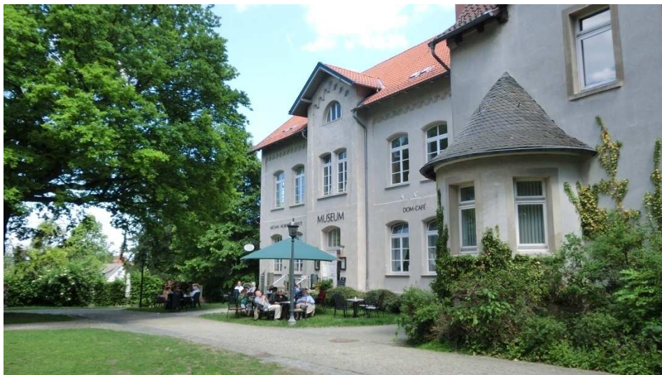
Museum für Mechanische Musikinstrumente und Dom-Café