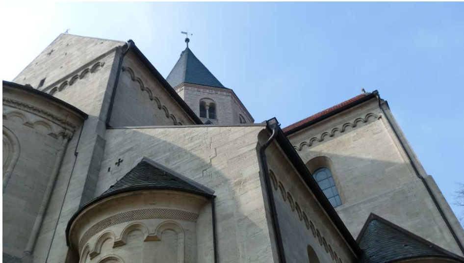
Kaiserdom in Königslutter