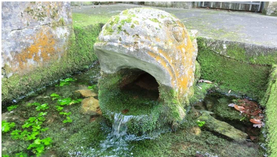
Der Quelltopf der Lutter