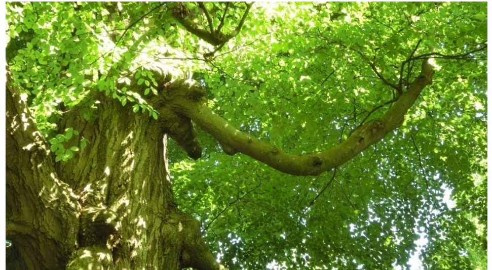
Der Elefantenkopf im „Arborrex“