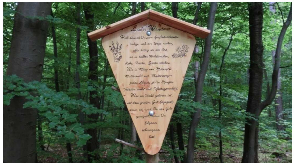
Verhaltensregeln für Wanderer im Hainholz