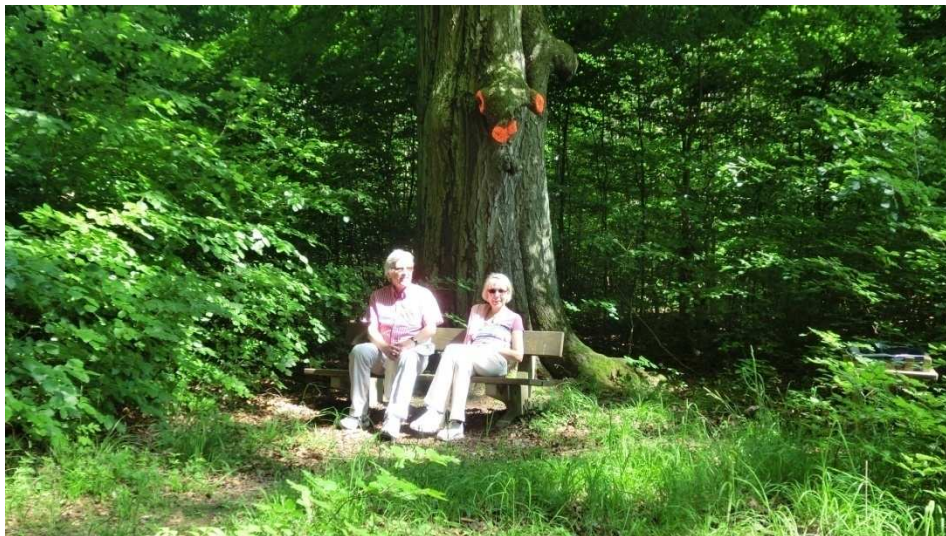
Pause im Tiefen Tal