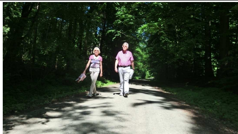
Auf dem Weg in Richtung Tiefe Tal